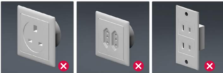
Ejemplos de bases de toma de corriente de otros países como Reino Unido, Italia y Estados Unidos.