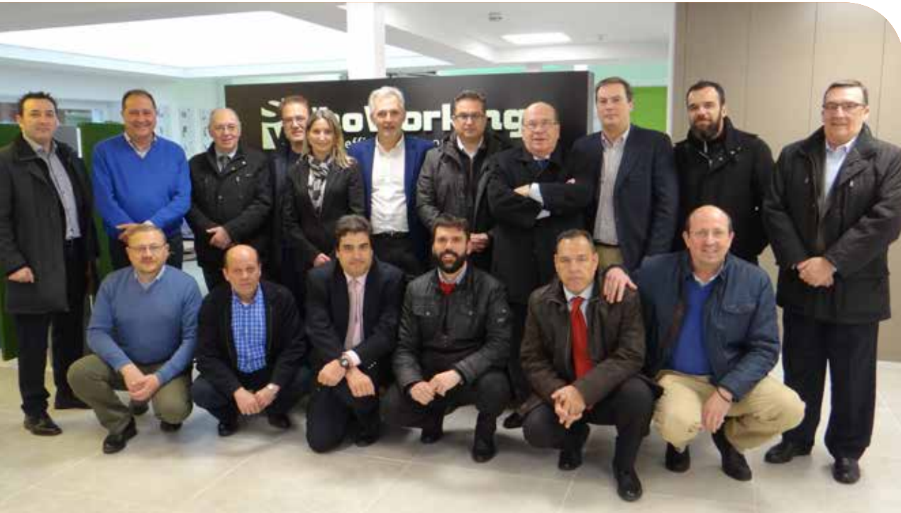
Visita de la Junta directiva de Agremia a las instalaciones de Showworking.

Como acciones concretas el personal docente de Agremia, ha estado recibiendo formación específica sobre los sistemas de bombas de calor aerotérmicas y geotérmicas mediante hibridación a sistemas de energías renovables como, por ejemplo, la fotovoltaica. La finalidad de esta formación previa es poder desarrollar cursos de estas tecnologías para el conjunto del sector que tanto nos esta demandando.