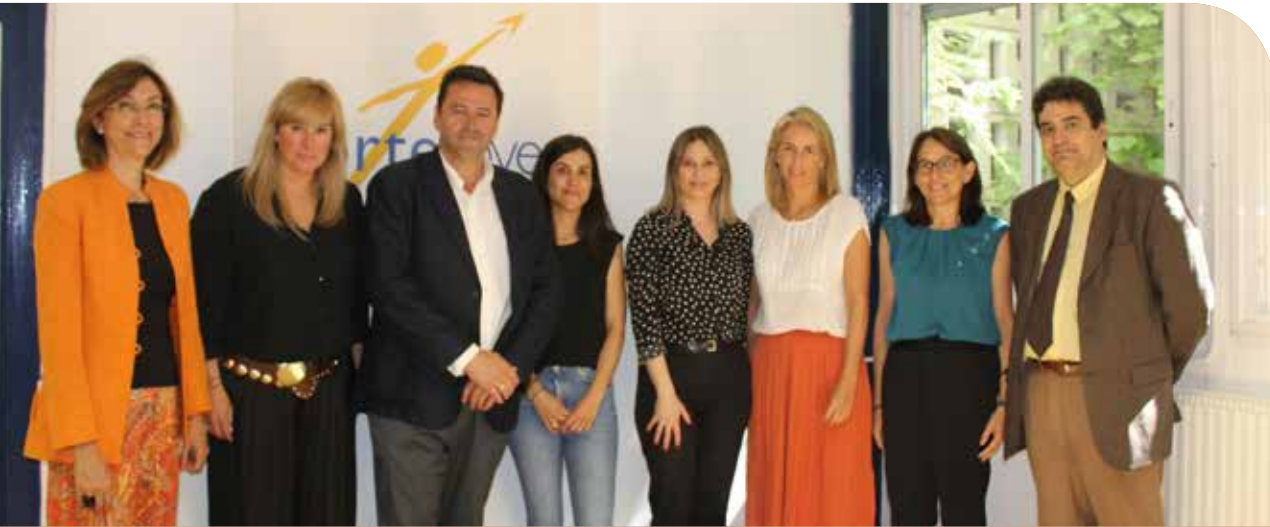
Acuerdo entre los representantes de Agremia, Avintia, Fundación Endesa, Asociación Norte Joven y Aclimar.