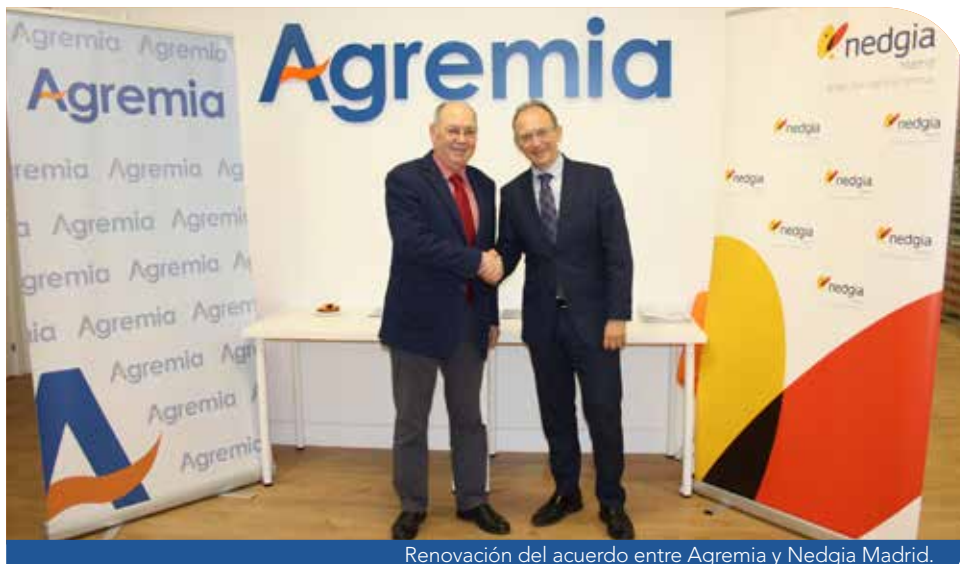
Renovación del acuerdo entre Agremia y Nedgia Madrid.

A lo largo del año 2018 se han incrementado los trámites que las empresas asociadas realizan a través de Agremia, siendo 1056 los nuevos puntos de suministro tramitados por la Asociación y 317 las empresas instaladoras adheridas al acuerdo, convirtiendo a Agremia en la asociación líder por número de expedientes en España.