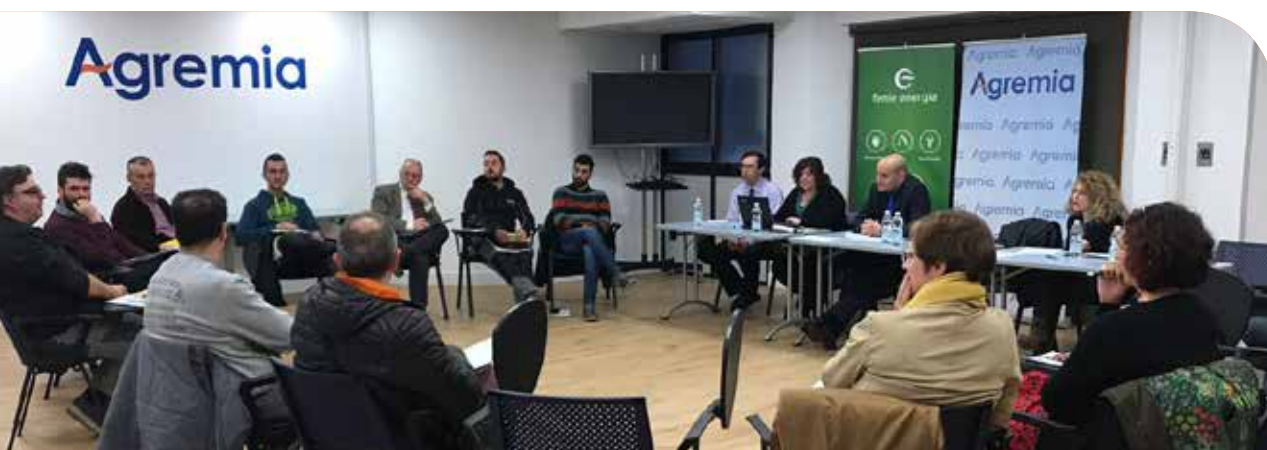
II Mesa de agentes de Fenie Energía.

Agremia, en su objetivo de apoyar el inicio de la singladura de la actividad de los Agentes Energéticos formados en la asociación y de fomentar la interlocución con la comercializadora, continuó con su iniciativa pionera comenzada en 2017, organizando la II Mesa de Agentes de Fenie Energía . Se celebró el 22 de febrero de 2018 y el fin era escuchar sus dudas, inquietudes y experiencias para que la Comercializadora pudiera dar una respuesta efectiva in situ pues en esta ocasión, nos reunimos los tres actores principales: agentes, personal de Fenie Energía y de Agremia.